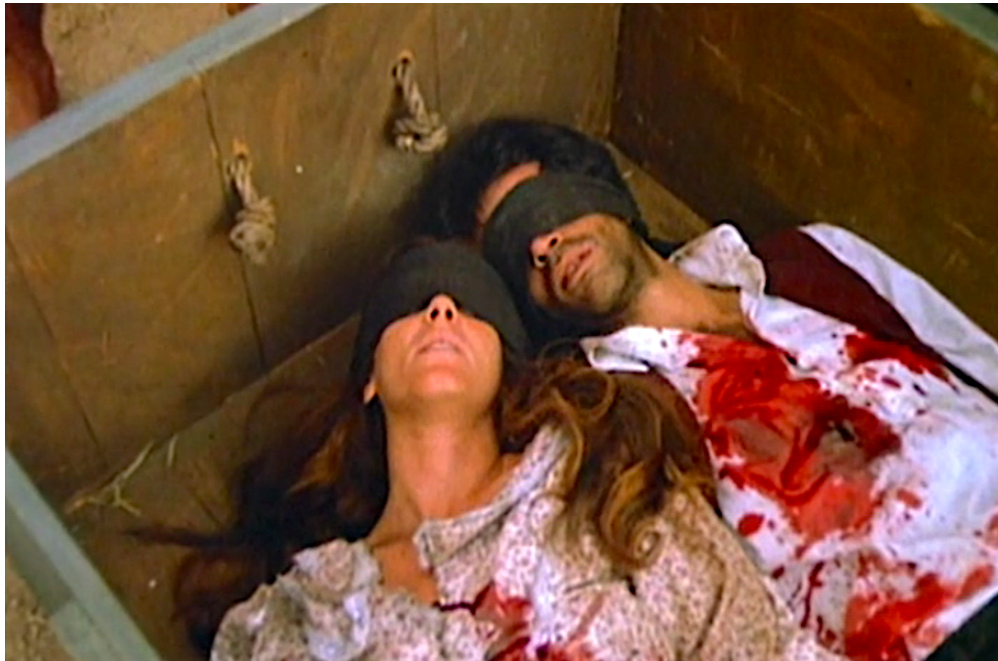
Imagen 1. Fotograma de la película. Camila y Ladislao después del asesinato.

Desde esta lectura, Ofelia-349 es muy parecida a Camila, salvando las diferencias obvias, en tanto sus pensamientos o deseos de independencia anteceden su muerte. Ofelia-349 se revelará y, por un momento, tendrá una voz compartida con las otras Ofelias. Como en una fábrica, los Shakespeares producen Ofelias para morir en las múltiples versiones de Hamlet que nosotros leeremos algún día. Pero después de ‘escupir la realidad’ que el programa Elsinor 3.0 les ha diseñado, cuando decidió no morir la muerte programada por la máquina patriarcal virtual, Ofelia(s) no solamente perdió(eron) sus voz(ces) sino que, como le ocurrió a Camila, la(s) borraron. Del mismo modo, si recordamos lo que le preguntó la madre de Camila a su esposo, tal gesto simboliza cómo ella (la madre al igual que Camila) también escupió la realidad, pero sin la habilidad de escapar de ella. Ambas, Camila y Ofelia-349, son un resultado de la fabricación del hombre, heterosexual masculino, y aunque no quieren ser lo que son dentro del sistema del patriarcado en la máquina, no pueden escapar por culpa de la amenaza que percibe en