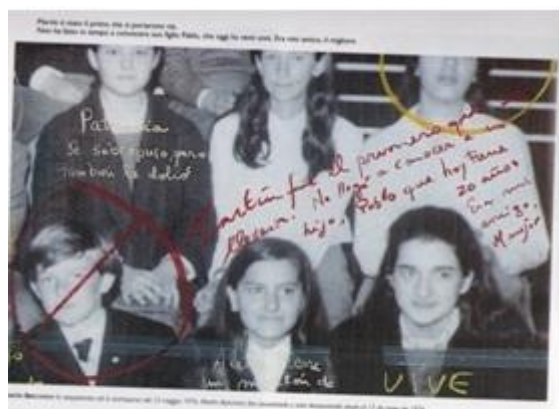
Foto 6: Imagen que abre el homenaje a Martín. Buena Memoria de Marcelo Brodsky (2000).

Las imágenes de los presentes (ver foto 7), fueron emplazadas como un gran mosaico, en una de las paredes del MAM; todas fueron enmarcadas en el mismo formato y las imágenes son a color. En cambio las fotos dedicadas a Martín y Fernando están sobre otras paredes y en distintos formatos y tonalidades, algunas sepia, blanco y negro, y otras en color, pero en un tono de archivo, algo desgastadas por el tiempo. De alguna manera, los presentes parecen todos iguales, mientras que los ausentes no, ellos dejaron un vacío que hay que llenar.