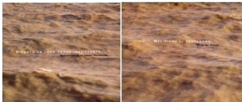
Foto 16: Río de La Plata. Buena Memoria de Marcelo Brodsky (2000).

Y, finalmente, las fotos al Río de la Plata (foto 16), sobre su agua amarronada se lee “al río los tiraron. Se convirtió en su tumba inexistente”. Este grupo de imágenes cierra el sentido de la muestra, sobre la búsqueda y la necesidad de una sepultura, y de alguna manera estas fotos parecen reemplazar las tumbas, esenciales para un momento de duelo y elaboración de la falta.