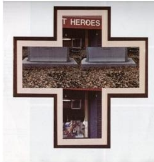
Foto 14: "Héroes de familia". Buena Memoria de Marcelo Brodsky (2000).

En la foto 14 vemos una suerte de collage que forma una cruz; entre las imágenes que la componen, se encuentran una a la palabra "Héroes", en el centro dos fotos de un par de lápidas y de la tierra en donde están emplazadas, la toma se corta en donde empiezan los nombres escritos en la piedra y, por último, cierra una imagen de unos dibujos de siluetas de colores flotando. A esta imagen la sigue la de una escultura del busto de Fernando, realizada por su mamá (ver foto 15), la misma está en un altar familiar junto a objetos religiosos.