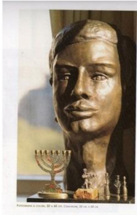
Foto 15: Escultura del busto de Fernando. Buena Memoria de Marcelo Brodsky (2000).

Y, finalmente, las fotos al Río de la Plata (foto 16), sobre su agua amarronada se lee “al río los tiraron. Se convirtió en su tumba inexistente”. Este grupo de imágenes cierra el sentido de la muestra, sobre la búsqueda y la necesidad de una sepultura, y de alguna manera estas fotos parecen reemplazar las tumbas, esenciales para un momento de duelo y elaboración de la falta.