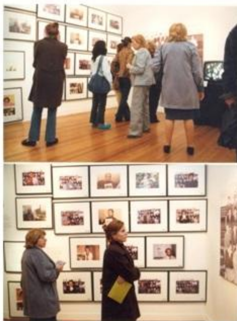
Foto 7: Imagen del montaje. Foto durante la inauguración de la muestra. Muestra Buena Memoria de Marcelo Brodsky, mayo 2003.

Al ver los textos que hacen parte de estas imágenes, podemos ver que se parecen más a recuerdos nostálgicos expresados por el fotógrafo, que a un trabajo sobre la biografía de ambos desaparecidos. Todos los datos son autoreferenciales, siempre apelando a sus propias sensaciones y sentimientos, por lo que parecen recuerdos vagos e inconexos. Según Battiti,