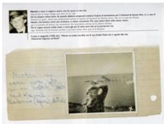
Foto 5: Detalle de la foto escolar, donde se marca a Martín. Buena Memoria de Marcelo Brodsky (2000).