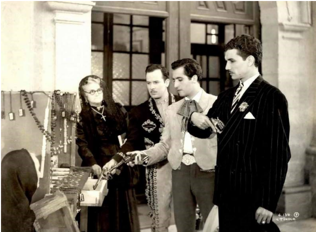
Figura 12 Vidal, Enrique. “ Los tres García. ” SEDECULTA, Biblioteca Virtual de Yucatán, Acervo de la BVY. Fotograma. 9 mayo 2017. Web.

García revierte el orden patriarcal de los roles femenino y masculino en la pantalla cuando prolonga el peso de su figura materna en la vida real y se erige asertivamente aún por encima del ídolo. Esto fue posible porque García infantilizó a Infante en la ficción apoyada en la verosimilitud de la cotidianidad, en donde se demuestra el favoritismo por el hijo varón mediante el trato infantilizado. Esta dinámica entre madre e hijo se extiende a lo largo de la vida porque, como se describió en la sección anterior, el hijo varón prolonga forzosamente la relación edípica al subalternar a la madre como una forma de reclamar su privilegio de género. Sin embargo, la infantilización también expone inmadurez, desequilibrio e ineficiencia, justo como la conducta errática de Infante que García se encarga de exponer en la ficción y en la realidad.