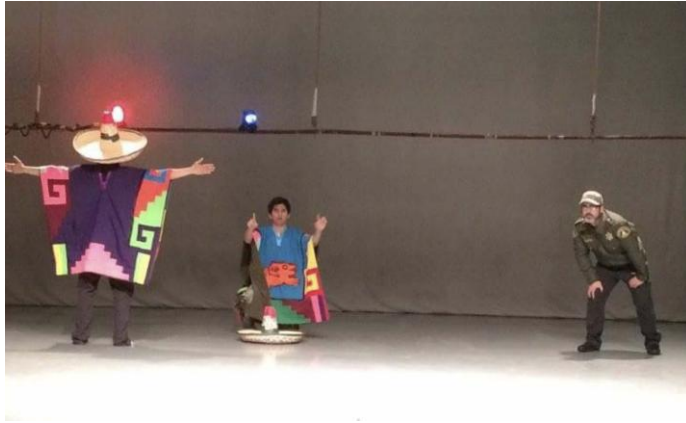
La cubeta de los cangrejos.

Quienes se encuentran en el recorrido de la frontera no se pueden permitir el placer de hacer amistades, menos si los conocen en semejantes circunstancias, y así nos lo deja claro el personaje de Elvia, sin saber cuál es el camino que tomará su compañera. El autor está dejándonos en la generalidad de la pieza una capacidad que permite ir avanzando en las posibles acciones de uno u otro personaje, al menos de manera intuitiva. Y esta capacidad vale la pena ser mencionada. En el mismo diálogo, cuando entra, el Pollero se dirige al público y lo increpa, esta es una acción que hará en repetidas ocasiones, y se entiende como parte de la propia concepción del personaje, es así que, en la escena II, el final de la VII, cada una de las siete secuencias de la IX y el final de la XII, tenemos los diálogos del Pollero con sus voyeurs , para recordarnos el papel que ocuparemos en un posible futuro.