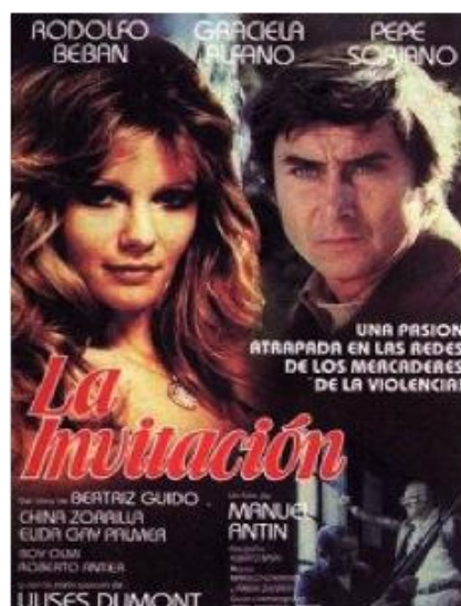
La invitación (Manuel Antín – 1982)

“El 20 de junio de 1973 se produjo en Ezeiza por la acción de minorías armadas, un hecho de sangre que, como otros ocurridos en la última década, ha sido testimonio trágico del empleo de la violencia en la lucha por el poder” [...]”