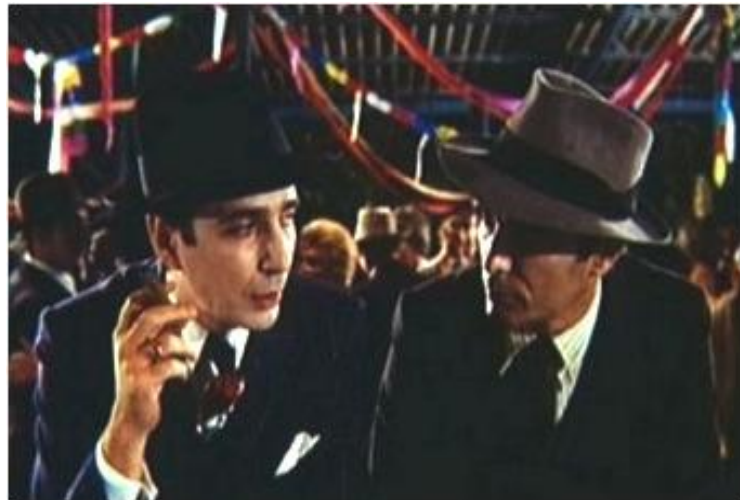
Los siete locos (Leopoldo Torre Nilsson – 1973)

Por supuesto, la complejidad de los dos textos y su temible carga de angustia necesitaban una traslación precisa. Los cuatro guionistas introdujeron elementos pintorescos que nada tienen que ver con ese estado de ánimo. Además del deambular de El Rufián Melancólico y Erdosain por kilombos y bailes, se introduce un moderno casamiento religioso inexistente en Arlt. Mientras aparece en pantalla, Elsa, que se queja por vivir en la miseria, luce modelos copiados de la revista El Hogar . La fotografía color de Aníbal Di Salvo, demasiado brillante, tampoco ayuda a crear el necesario clima de desesperación. Por otra parte, falla la marcación de actores y solamente al final, cuando el suicidio de Erdosain en el tren, el encuadre y el montaje resultan apropiados.