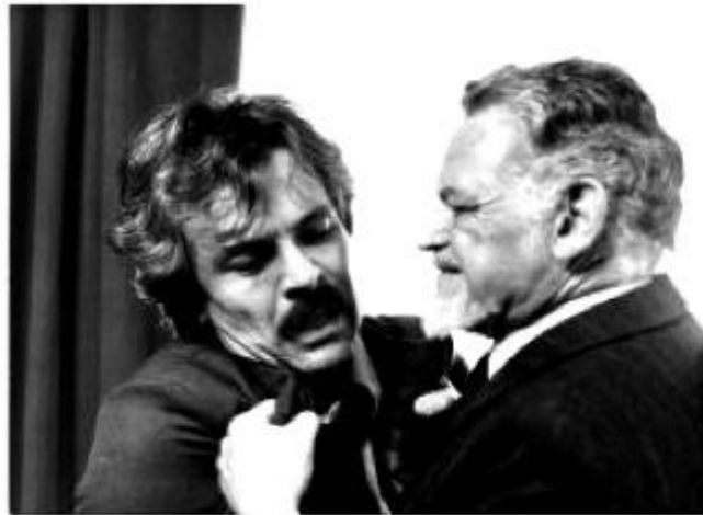
Gracias por el fuego (Sergio Renán – 1984)

Otro patriarca aparece en GRACIAS POR EL FUEGO (Sergio Renán-1984), basada en la novela homónima de Mario Benedetti de 1965. El texto literario, con técnica de narrador omnisciente, se ocupa de manera preferencial por la figura de Ramón, el hijo mayor de Eduardo Budiño. Esta familia, según la novela, pertenece a la alta burguesía uruguaya. Sin embargo, los guionistas Renán y Juan Carlos Gené optaron por no mencionar país alguno. Más aún: la película se rodó tanto en Montevideo como en Buenos Aires. Lo que se intentó fue presentar un prototipo de moderno caudillo latinoamericano. Benedetti otorgó a la novela un fuerte matiz político, pero esto se atenúa en el texto fílmico, ya que las alusiones a Estados Unidos desaparecen. Gené y Renán dieron preferencia a los conflictos familiares, en especial al fuerte desacuerdo afectivo entre padre e hijo.