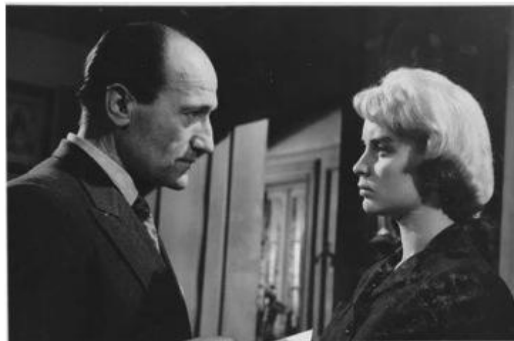
La caída (Leopoldo Torre Nilsson – 1959)

Con LA CAÍDA (1959), según el texto homónimo de Beatriz Guido, Leopoldo Torre Nilsson retoma la línea inaugurada con GRACIELA (1956) (62). Como en este film, la provinciana Albertina Bardem llega a Buenos Aires procedente de San Nicolás, para estudiar Filosofía y Letras en la antigua Facultad de la calle Viamonte. Albertina ha vivido desde su infancia en un mundo de ensueño, alimentado por las grandes novelas y sus héroes. Ha imaginado un alma gemela: un solitario lector, habitante de una estancia perdida en los alrededores de San Nicolás. Creerá que el tío Lucas, un viajante de comercio, supuesto aventurero cazador de animales salvajes, es el héroe novelesco que ella ama y aguarda.