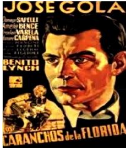
Los caranchos de la Florida (Alberto de Zavalía – 1938)

manejo de la estancia, sino también los favores de la joven Marcelina, cuya función es la de ser meramente un objeto sexual.