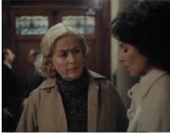
Pubis Angelical (Raúl de la Torre – 1982)

También Ana, la protagonista de PUBIS ANGELICAL (Raúl de la Torre-1982) tiene su propio deterioro: está siendo tratada por cáncer en una clínica de México DF. Esta adaptación de la novela homónima de Manuel Puig, fue guionada en Río de Janeiro por el cineasta y el escritor (36). La zona realista de ambos textos –que incluye, además de Ana, a Beatriz, Pozzi y Alejandro- intenta una explicación del panorama político argentino de mediados de la década del '70. Por otra parte, en su agonía, la protagonista comienza a escribir un diario dirigido al padre. Existen dos segmentos oníricos: en el primero, Ana es una estrella del viejo cine de Hollywood; en el segundo, se convierte en Dorita o W218, una especie de robot sin sentimientos que complace sexualmente a gerontes. El melodrama gira hacia el folletín adhiriendo a la cursilería de la prosa de Puig dedicada al área de la estrella de cine.