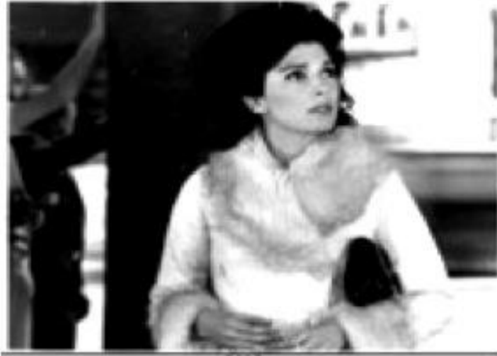
Heroína (Raúl de la Torre – 1972)

En cambio, las escenas dedicadas a Penny y al psicoanalista costarricense –en el texto literario es japonés-, demuestran que de la Torre sabe cómo vender un producto gracias a la técnica publicitaria. Complicación no es complejidad, axioma que parece no haber sido tenido en cuenta. Orientada hacia el folletín, al menos en la historia de Penny, la película integra este corpus porque el grito de la heroína filmica sintetiza, de manera curiosa, el denominador común de estos melodramas del grupo familiar: la ausencia de una figura materna.