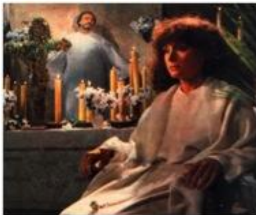
Los viernes de la eternidad (Héctor Olivera – 1981)

No siempre la traición y el abandono, en estos melodramas pasionales, están tomados de manera tan solemne. Pueden dar cabida al humor, la frivolidad y la magia. En 1970, la novela de María Granata, Los viernes de la eternidad , había logrado el premio Emecé. ARIES CINEMATOGRAFICA decidió llevarla al cine en 1981 con la dirección de Héctor Olivera. A tal efecto, autora y realizador firmaron un guión que no se aparta del texto literario original. Se respetan las relaciones simultáneas entre Delfina Salvador con el viejo Gervasio Urquiaga y el joven Juan Ciriaco Fuentes. Si la película comienza cuando Urquiaga descubre a Delfina en el lecho con Juan Ciriaco, generando el duelo criollo en el que morirán ambos hombres, la novela elige a Paula Luna, la mujer del viejo Urquiaga como la rencorosa, engañada y fiel esposa para inaugurar la historia. Son treinta y cinco años de matrimonio –Paula- versus tres años de desvaríos -Delfina-.