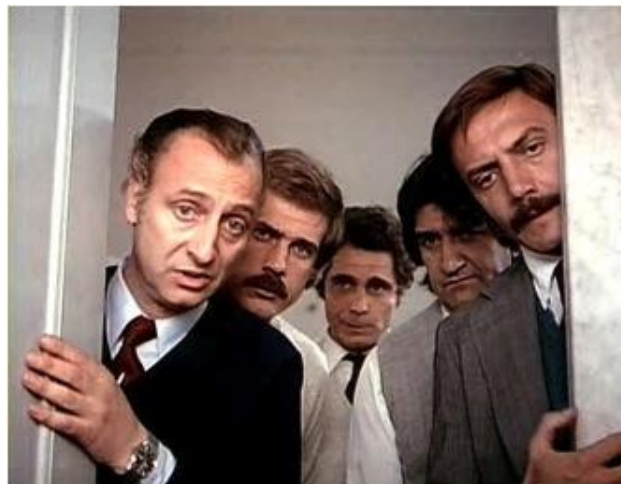
La tregua (Sergio Renán – 1974)

la vida rutinaria del narrador a punto de jubilarse. Este padre de tres hijos -Esteban, Blanca y Jaime- es jefe de personal de una empresa privada y la proximidad de la jubilación lo enfrenta con un vacío existencial. Se enamora de una nueva y muy joven empleada, Laura Avellaneda, e inicia con ella una relación amorosa que terminará en convivencia. La felicidad es breve, porque Laura enferma y muere de manera inesperada, pocos meses después.