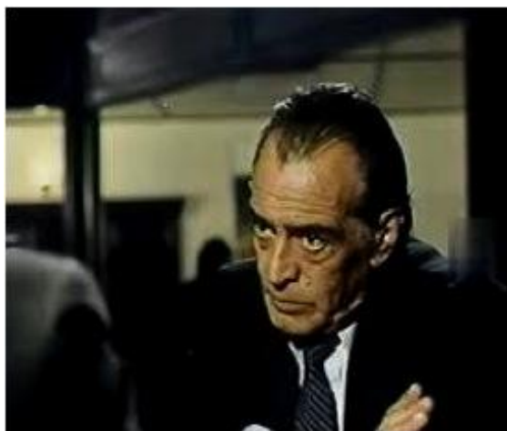
Cuarteles de invierno (Lautaro Murúa – 1984)

Los militares impiden la actuación de Galván, quien aparece en una lista como firmante de ciertas solicitudes inconvenientes . Lo que en realidad lo pone en peligro es la información que recibe del croto Mingo, otro marginado, acerca del terror imperante. A todo esto se suma el hecho de que el cantor no sigue las directivas que quieren imponerle las autoridades. Rocha, por el contrario, está sumamente interesado en la pelea, ya que se trata de su última oportunidad como profesional. Lo que no sabe es que el contrincante es un joven teniente primero, Sepúlveda, que debe derrotarlo para que Colonia Vela saboree el triunfo.