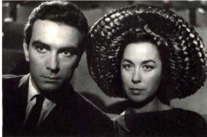
Las ratas (Luis Saslavsky – 1963)