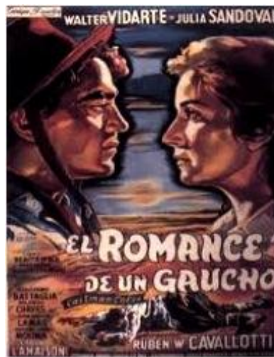
El romance de un gaucho (Rubén Cavallotti – 1961)