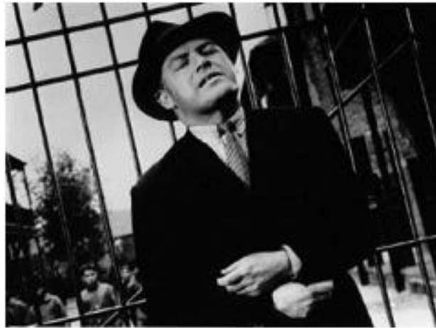
Fin de Fiesta (Leopoldo Torre Nilsson – 1960)