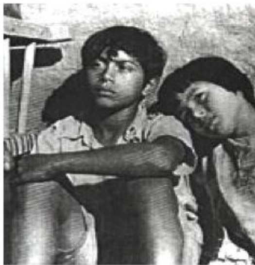
Shunko (Lautaro Murúa – 1960)

Por una parte, los pobladores construyen la escuela; por la otra, se acepta la medicina alopática cuando Shunko sufre una infección en la rodilla. En ambos casos, se tiene en cuenta el aporte del maestro. Dentro de las creencias locales aparece Ana Vieyra. En la película, la muerte de esta niña de trece años es apenas un flashback. Tanto en la novela como en el film, el espíritu de la niña muerta permanece en la escuela. En el guión de Roa Bastos, otra criatura que muere por la picadura de una víbora, Reyna, prima de Shunko, ocupa más espacio filmico: desde el comienzo hasta poco antes de que el maestro se vaya del lugar.