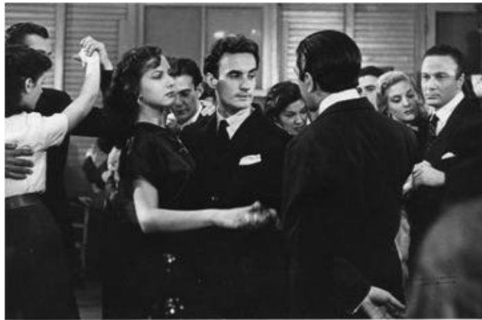
Barrio gris (Mario Soffici – 1954)

En tres momentos, al director le interesa señalar que estamos en el cine : en primer lugar y el más obvio, se asiste a una proyección cinematográfica de una serial muda para público infantil. En segundo término, Federico niño ve, desde la ventana del almacén donde trabaja, a la pareja de italianos y obtiene una visión sutil del erotismo. Y por último, el paneo por las fotografías restauradas y embellecidas por el viejo don Gervasio remite a la engañosa fascinación del arte (61).