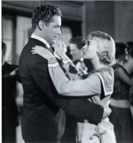
La casa del ángel (Leopoldo Torre Nilsson – 1957)

Otra novela de Beatriz Guido, La invitación (1979) fue elegida por la actriz Graciela Alfano para convertirse en productora. La película homónima fue dirigida por Manuel Antín –en su última incursión cinematográfica- y se estrenó en 1982. Los dos textos tienen como tema central el contrabando de armas. La acción se desarrolla a fines del verano de 1973. Si la novela tiene un narrador en primera persona –Gustavo Cambón Zurbarán, el segundo de los hijos- la película opta por el narrador omnisciente. La misteriosa llegada de un tal Julián Sánchez –con guardaespaldas en la novela y sin ellos en la película- causa una crisis entre los jóvenes Cambón Zurbarán: hasta el momento habían creído que su padre se dedicaba a la exportación de cemento a Chile. Se enteran de que Sánchez ha llegado para vender armas. Se produce un enfrentamiento entre el huésped y los hermanos Elisa, Gustavo y Juan Pablo. A partir de este momento, Sánchez entra en conflicto. El lector o espectador debe suponer que un traficante de armas puede conmoverse por el planteo de los jóvenes.