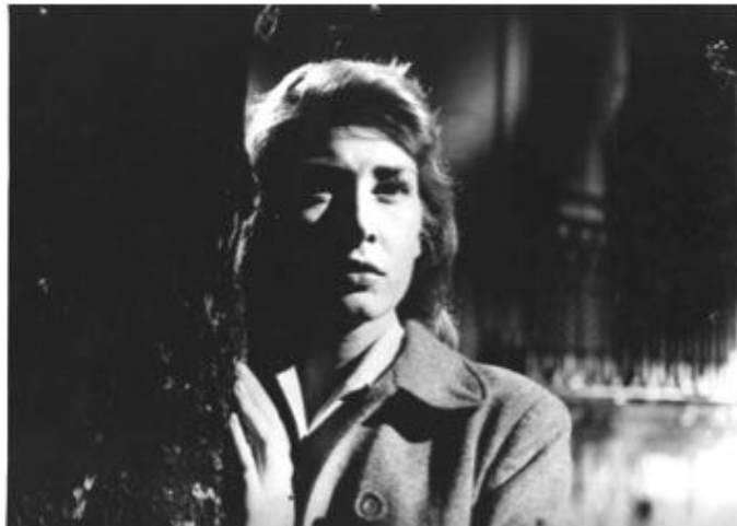
Una cita con la vida (Hugo del Carril – 1958)

No siempre los jóvenes deben ser complejos e intelectuales para estar representados en esta clase de melodramas basados en novelas. Tal el caso de UNA CITA CON LA VIDA (Hugo del Carril-1958), según la novela Calles de tango de Bernardo Verbitsky, publicada en 1953.