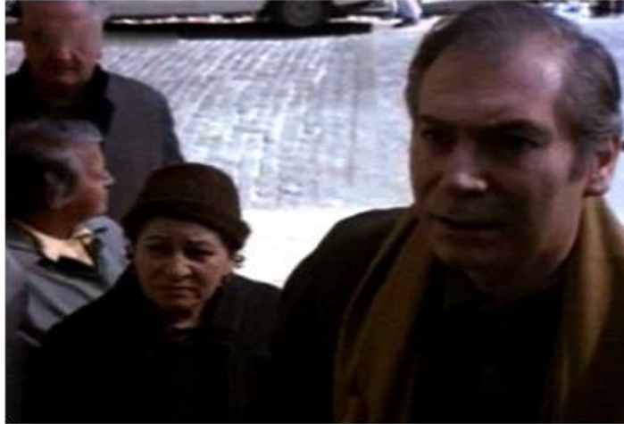
La guerra del cerdo (Leopoldo Torre Nilsson – 1975)

Los guionistas caen en el error de considerar que la fecha de publicación de la novela de Bioy Casares –1969- es la misma en la que transcurre la acción del diario ficticio. Cabría preguntarse si fue un error o un acto premeditado, teniendo en cuenta que, al estrenarse la película, en 1975, el país se encontraba en el prólogo del terrorismo de Estado, que acabaría con la vida de miles de jóvenes. Los cerdos concebidos por Bioy Casares impondrían el orden y saldrían triunfantes. No se otorga precisión a la época que habitan los personajes. Así, un taller de costura y un conventillo se mezclan con un juego de bowling y la música beat, estos dos últimos elementos ajenos al texto de Bioy y contraproducentes en la creación de atmósfera. El relato de Torre Nilsson, salvo algunos planos detalle arbitrarios, queda anclado al viejo discurso de los estudios. En su penúltima entrega para el cine, el director pareciera excesivamente preocupado por presentar a los jóvenes como terroristas: palizas despiadadas a los ancianos, incendio del geriátrico, disparos nocturnos, persecuciones y desavenencias entre los agresores. Como en 1975 se había iniciado la matanza generalizada en el país con las tres A (93), que preludiva el golpe de Estado de marzo de 1976, se hace necesario un improbable final feliz: Vidal, el viejo, y Nélida, la joven, quedan anclados en el patio de las glicinas. Se desliza, de este modo, por el sendero del folletín.