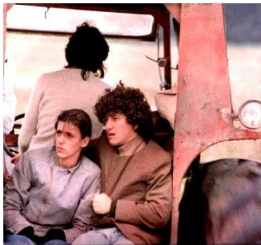
Perros de la noche (Teo Kofman – 1986)

En cuanto a Perros de la noche , los hermanos Mercedes y Mingo, habitantes de una villa miseria, han quedado huérfanos. La primera trabaja en una fábrica de Morón, provincia de Buenos Aires. El segundo elige el camino del robo y cae preso. Ya en libertad, obliga a su hermana a prostituirse, luego de haberla iniciado en el sexo, incesto mediante. Tras un aborto, Mercedes, alentada por Mingo, se interna en locales de ínfima categoría para trabajar como stripteasera. Se presentan como marido y mujer. Las deudas de juego de Mingo les impiden sobrevivir. Después de un robo, inician un periplo que concluye en el rodaje de una película pornográfica. Ante el maltrato que sufre Mercedes deciden regresar a la villa. Al concluir la novela, el lector comprueba que Mingo es asesinado por las deudas de juego.