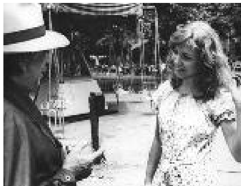
Crecer de golpe (Sergio Renán – 1977)

Tanto la novela como la película se adscriben a la idea pequeño burguesa de la fatalidad. Desde esta perspectiva, es imposible escapar a los mandatos del destino. Contra lo que algunos teóricos opinan con respecto al melodrama, a pesar del sufrimiento vale la pena vivir a fondo una tregua . De este modo, el melodrama argentino se diferencia notablemente del de otros países latinoamericanos. Aunque Renán no fuera consciente, LA TREGUA radiografía formas de vida que se habían mantenido invariables durante décadas, al menos para la pequeño burguesía urbana. En este aspecto funciona como un réquiem, ya que los cambios sociales, políticos y económicos que sufriría este grupo, cambiarían radicalmente el concepto de familia, al menos el que se había aprendido en los viejos libros de lectura escolar y se había transmitido a través de los medios masivos de comunicación.