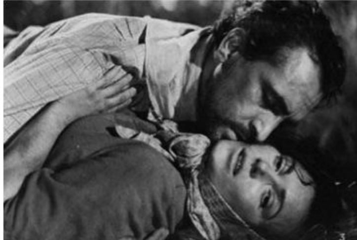
Las aguas bajan turbias (Hugo del Carril – 1952)