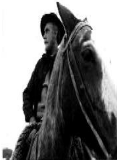
Don segundo sombra (Manuel Antín – 1969)

Me parece que hay tanto que decir en este país que me desespera no ser un hombre orquesta capaz de desentraña el aspecto poético, filosófico, musical y pictórico de una raza inexpresada. No pretendo por esto ser capaz de hacerlo; hablo sólo de una tentación.