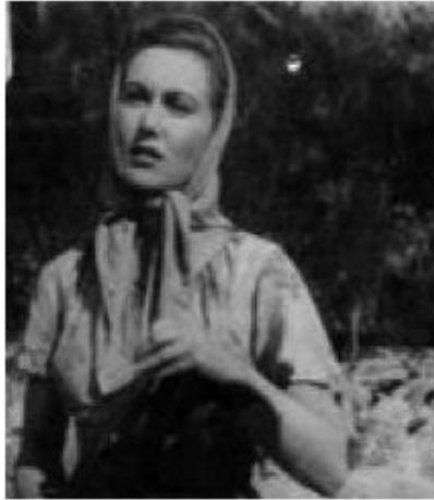
Donde comienzan los pantanos (Antonio Ver Ciani – 1952)

Son muy difíciles de olvidar los planos dedicados al cangrejal, los pajonales y las nutrias agonizando en las trampas. Estos planos contribuyen, de manera gótica, al melodrama. Al mismo tiempo, la pareja de los pantanos adquiere una valorable esfericidad. El texto de Bernárdez Jacques contiene ribetes folletinescos, a causa de una cantidad de peripecias: rapto, muerte del bebé, entierro y desentierro del mismo, huida de Paloma, encuentro de un hombre bueno que queda viudo justamente en el momento adecuado, una nueva hija, trágico e innecesario desenlace con el golpe bajo del asesinato de Paloma. Son hechos que podrían puntear una novela por entregas.