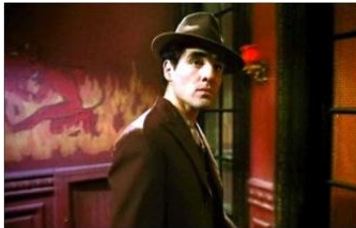
El sueño de los héroes (Sergio Renán – 1977)

Será en ese carnaval, donde se enfrentan los dos personajes antitéticos del melodrama, Federico el dominado y Claudio el dominador. El primero, en crisis debido a su noviazgo con Zulema, decide asumir una identidad que lo libere de la falsa que le ha otorgado Claudio. Ha llegado a tal extremo, que la única salida es aniquilar a la figura que “lo ha explotado como a una mujer de la calle” –Federico dixit-. Es el único y tardío camino para adquirir un yo propio. Terminará en la cárcel.