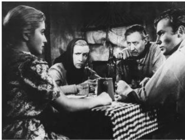
Los isleros (Lucas Demare – 1951)

El eje de la historia pasa por la relación Leandro Lucena-Rosalía Gómez –Arturo García Buhr y Tita Merello-, una pareja que se forma porque el hombre busca en el pueblo una mujer que le atienda el rancho. Se casan luego de concebir al hijo, Toño. Una segunda pareja es la conformada por Toño y Berta, muy distinta a la de los mayores. El comportamiento de los jóvenes excluye la violencia y exterioriza el afecto. La tercera es la de los extranjeros, signada por las consecuencias de la guerra.