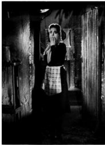
El inglés de los güesos (Carlos H. Christensen – 1940)

En el caso de Lynch, la naturaleza es por completo indiferente frente al dolor. El ser humano no logra una síntesis mediante la cual pueda obrar sobre ella. Por el contrario, es la naturaleza la que resulta vencedora. A esto se une la superstición o pensamiento mágico, según el cual con un gualicho, indicado por la curandera, el inglés se quedaría.