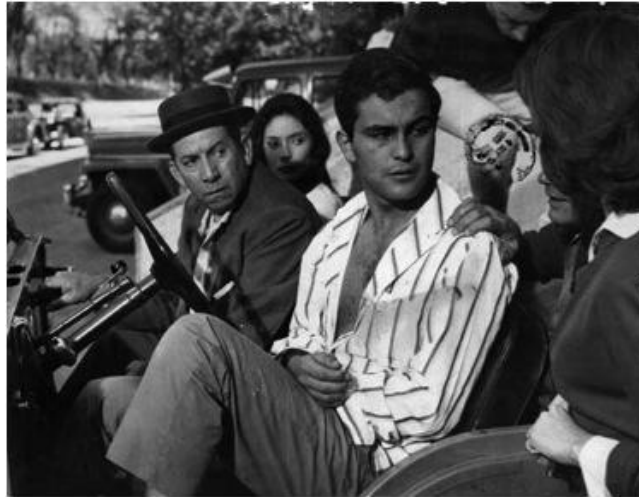
Dar la cara (José Martínez Suárez – 1962)