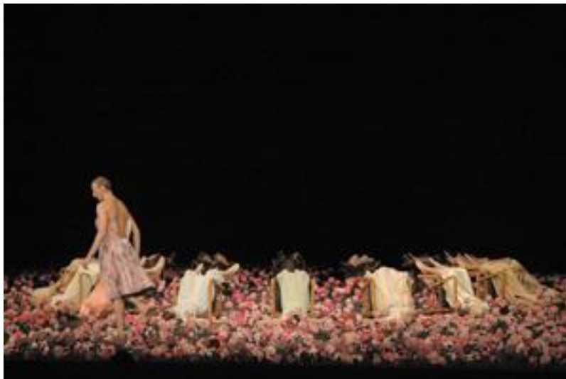
Nelken (Claveles) , de Pina Bausch y la compañía Tanztheater Wuppertal (estrenada en 1982).