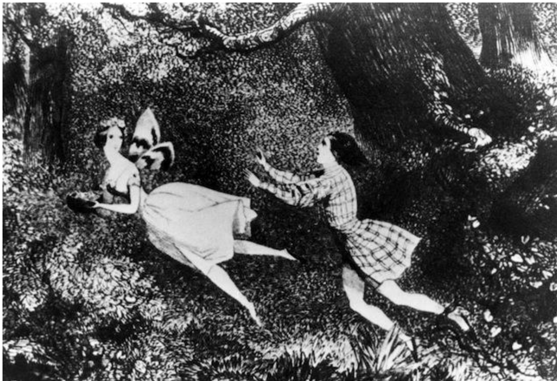
Grabado del siglo XIX. Escena de La Sylphide . James sigue a la sílfide. Tomada de Mario Pasi (coord.), El ballet. Enciclopedia del arte coreográfico , Madrid, Aguilar, 1980, pág. 98. Reproducción: Christa Cowrie.