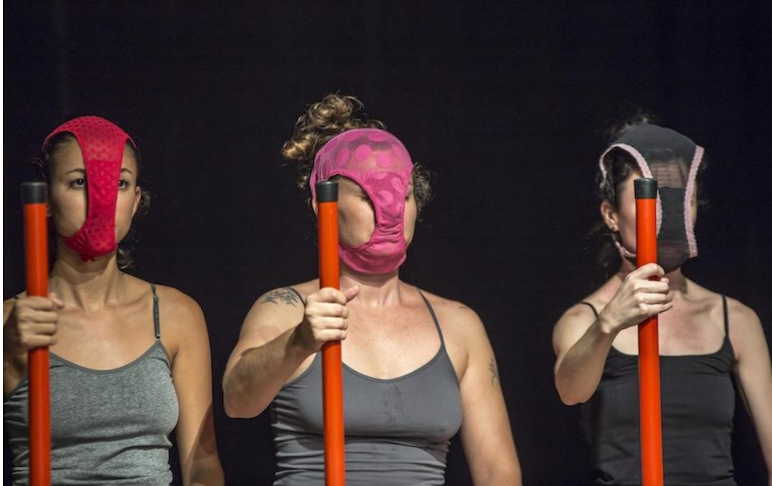
Sem Cabimento , colectivo Mapas e Hipertextos de Florianópolis, Brasil, 2015.