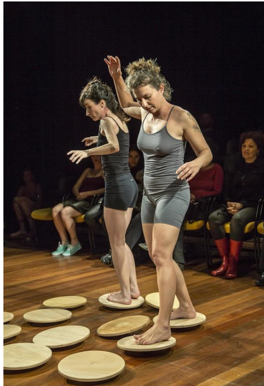
Sem Cabimento, colectivo Mapas e Hipertextos de Florianópolis, Brasil, 2015.