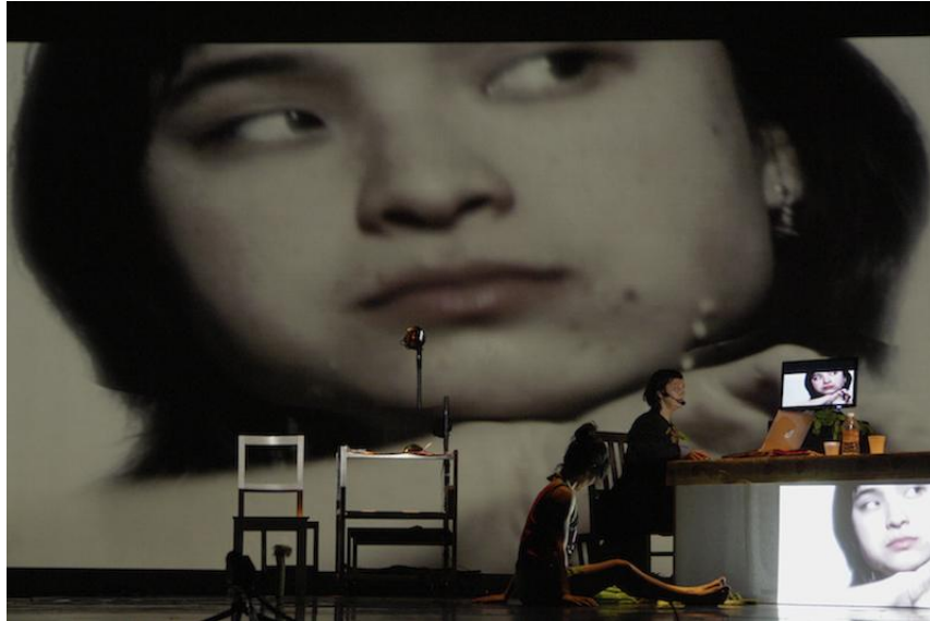
Kónic Thtr, Cherry Bone (2009).