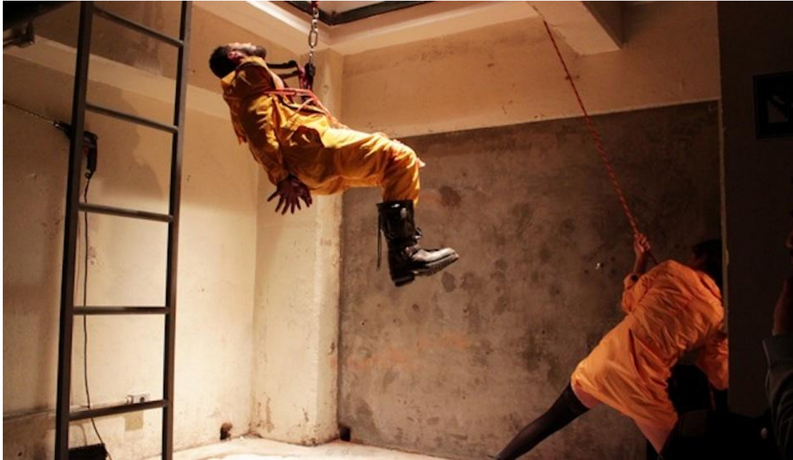
Escena de Ternura suite de Edgar Chías, dirección de Richard Viqueira (2010).