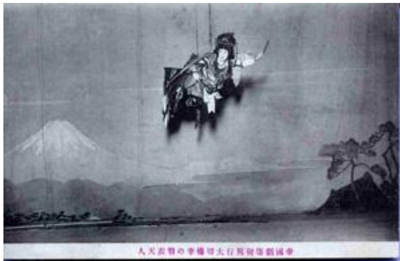
Hagoromo (Kabuki), 1911, Tokio (Cortesía de The Tsubouchi Memorial Theatre Museum, Waseda University).