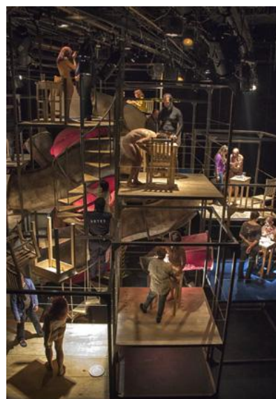
Aspectos de la obra Psico/embutidos. Carnicería escénica . Compañía Titular de Teatro de la UV (2014-15).