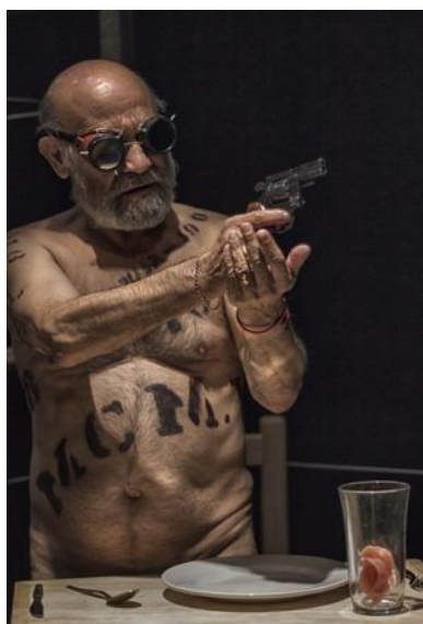
IMAGEN 1 Y 2