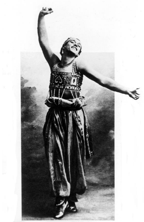
Nijinsky en Schéhérezade, 1911. Coreografía de Mikhail Fokine.