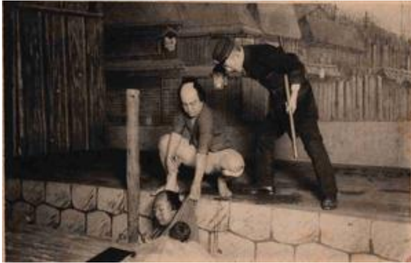
Suitengūmegumi no fukagawa (Kabuki de tipo zangirimono), 1909, Tokio (Cortesía de The Tsubouchi Memorial Theatre Museum, Waseda University).