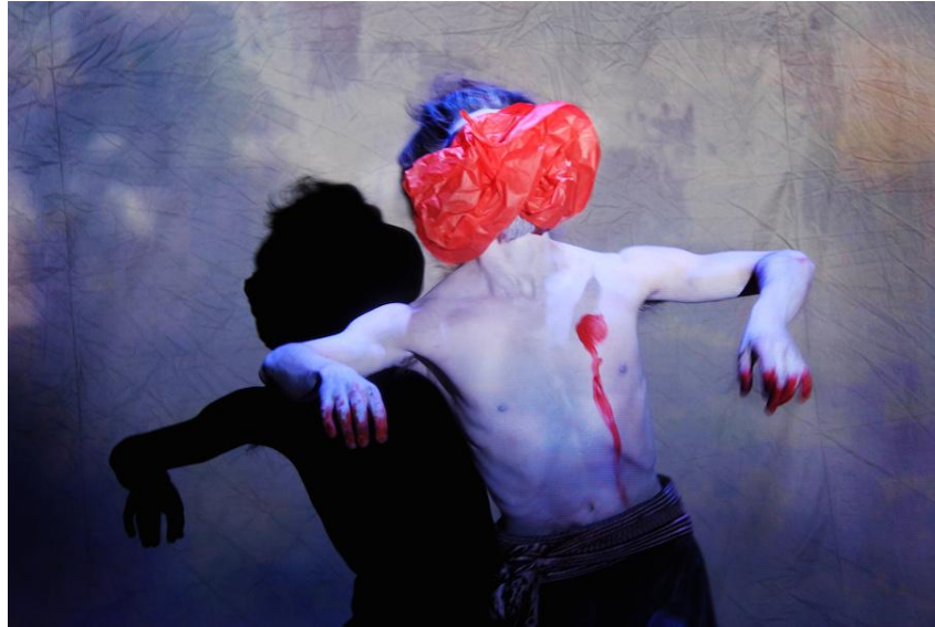
Carlos Iván Cruz, El silencio se mueve , 2012.